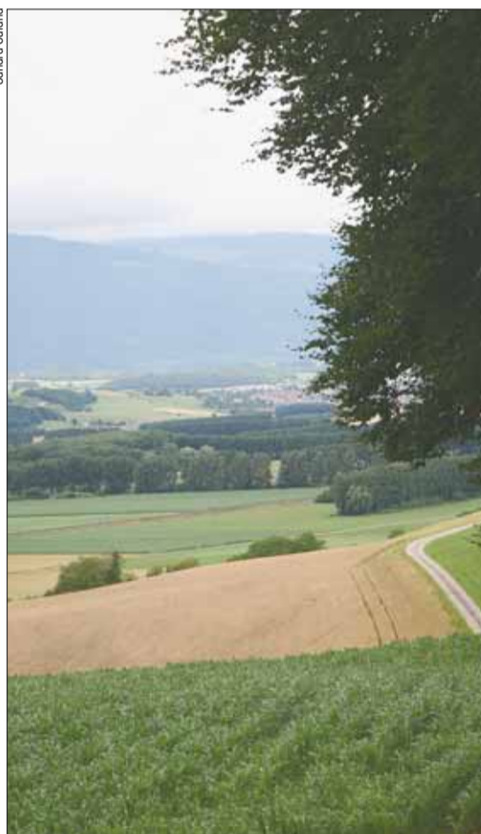
La nouvelle loi apportera un soutien substantiel à l'agriculture vaudoise.

culteurs indépendants à cotiser à une caisse de pension. Prométerre a fait connaître son désaccord, et a indiqué que l'obligation de cotiser à une caisse de pension ne pouvait se concevoir qu'à la double condition que la profession elle-même, par son organisation faitière, le demande, et que l'Etat participe à son financement, si possible dans une mesure paritaire. La commission a tenu compte de cette réaction.