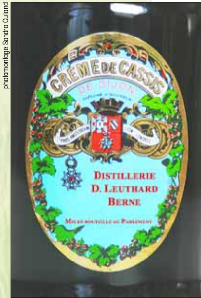
photomontage Sverre Culand