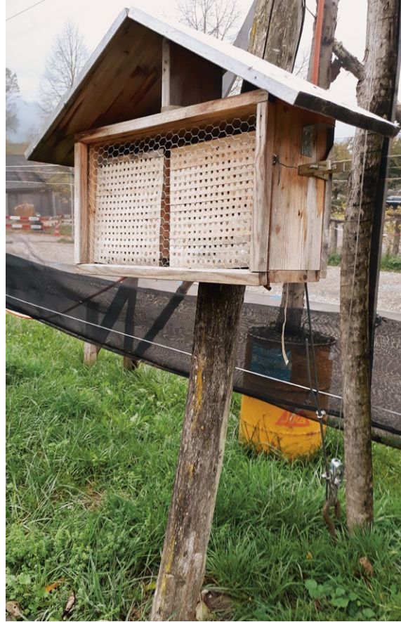
Le placement correct et la bonne orientation des nichoirs sont décisifs pour le développement et l'activité de pollinisation des abeilles sauvages.

Environ 40 à 45 jours après l'installation des cocons, la plupart des larves ont éclos. Pour limiter la propagation des parasites, les Chalcidoidea en particulier, les boîtes en carton contenant les cocons vides et les abeilles non encore écloses doivent être retirées du verger et éliminées.