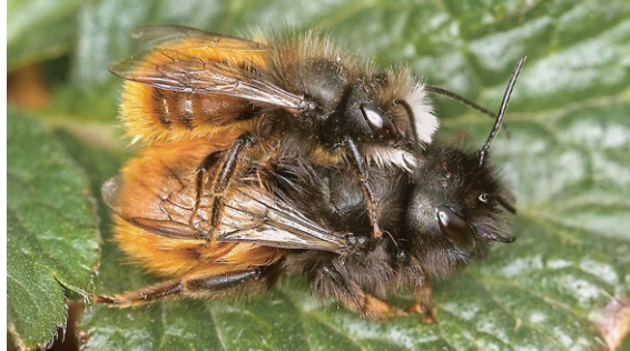
Femelle et mâle adultes de l'osmie cornue

L'osmie rousse éclot un peu plus tard et peut couvrir une période de floraison plus longue que l'osmie cornue. Elle se prête particulièrement à la pollinisation des espèces de fruits à flori-