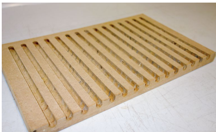
Les panneaux MDF avec des rainures fraîsées sur une face ont fait leurs preuves pour l'élevage des abeilles sauvages.

Au printemps, les panneaux empilés sont liés avec une sangle de serrage, pour former un bloc de nidification et être placés dans le nichoir. En automne, les différents panneaux peuvent être facilement séparés, pour prendre soin des cocons.