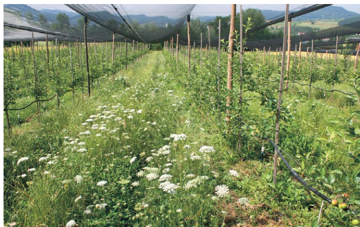
Les bandes fleuries vivaces semées peuvent servir de source de nourriture et favoriser ainsi la diversité naturelle des pollinisateurs.

S'agissant de la pollinisation par les abeilles, les plantes sauvages à floraison précoce n'entrent pas en concurrence avec les arbres fruitiers. Au contraire, elles constituent une importante source complémentaire de nourriture, en particulier lorsque l'offre de fleurs des arbres fruitiers est trop faible ou la durée de floraison trop courte.