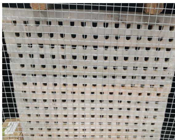
Les panneaux fraîsés sont empilés pour former des blocs de nidification.