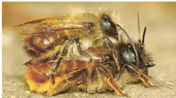
Femelle et mâle adultes de l'osmie rousse

son moyennement précoce à tardive comme les pommes, les poires et les baies.