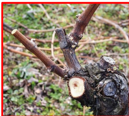
Figure 1: taille rase et mutilante à éviter, particulièrement lorsque l'on coupe du bois de plus de 1 an.

La période de la taille approche, ce travail n'est pas sans conséquences pour la vie des ceps. Depuis quelques années maintenant, Proconseil mène des expérimentations et observations sur la thématique des conséquences liées aux plaies de taille. La taille des coursans devrait être réfléchi en fonction des cépages. Une fiche thématique vous est proposée en pièce jointe de ce bulletin. Elle est également disponible en ligne sur VITplus.ch , rubrique Infos vitivinicoles puis Fiches thématiques .