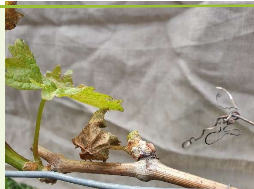
Figures 3 et 4 : rameau sectionné à quelques millimètres de la base à l'aide d'un sécateur à vendange pour préserver le bourgeon proche.