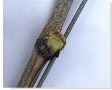
Figure 2: lors de la suppression des rameaux de gros diamètres, attention à ne pas endommager les bourgeons secondaires.

Cette deuxième option est chronophage mais peut permettre d'éviter le développement anarchique des entre-cœurs et de favoriser la production de bois utilisables pour la future taille. Les bourgeons secondaires sont également potentiellement plus fructifères que les éventuels grappillons portés par les entre-cœurs. Attention, cette hypothèse est sous réserve de la vigueur de la souche et des conditions météo de la période d'initiation florale de l'année passée, qui déterminent la fertilité plus ou moins importante des bourgeons latents (y c. bourgeons secondaires).