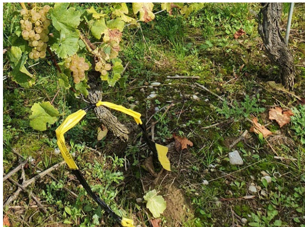
Figure 1: Rubalise jaune et noire, utilisée dans le cadre de la lutte contre la flavescence dorée dans le canton de Vaud.

Suite à la découverte de plans positifs à la flavescence dorée en dehors de périmètres de lutte obligatoire (PLO), deux nouvelles zones feront prochainement l'objet de décision de portée générale. Il s'agit de la zone de l'ancien PLO d'Yverne (abrogé en 2023) ainsi que d'un nouveau PLO autour de la colline de St-Triphon (commune d'Ollon). Des précisions vous seront données dans un prochain bulletin ainsi que lors des séances d'infos 2026.